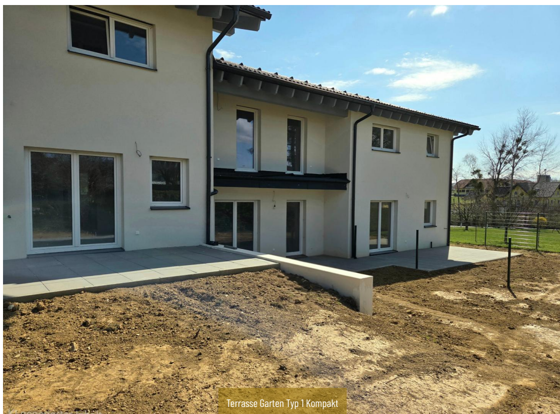
Terrasse Garten Typ 1 Kompakt